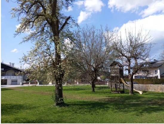
Blick von S/O