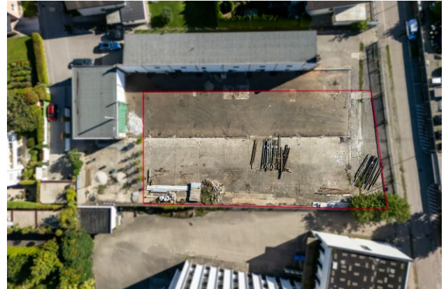
klare, rechteckige Konfiguration