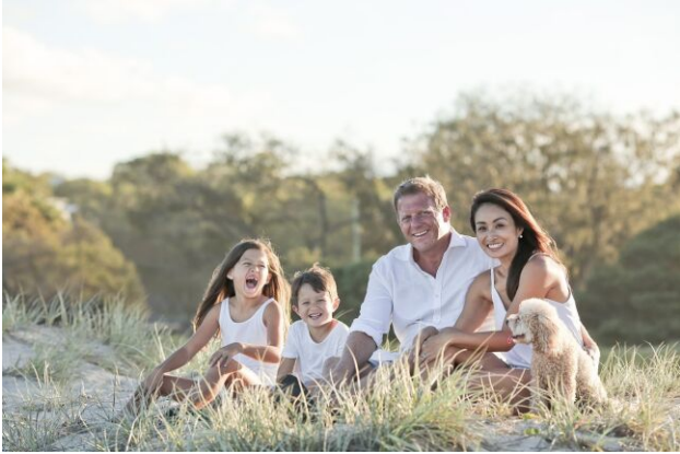
familienfreundlich und naturnah

KAUFEN & VERKAUFEN | BAUEN | FINANZIEREN | 50+