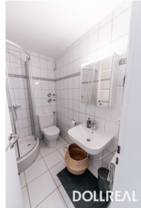
funktionelles, neuwertiges Bad