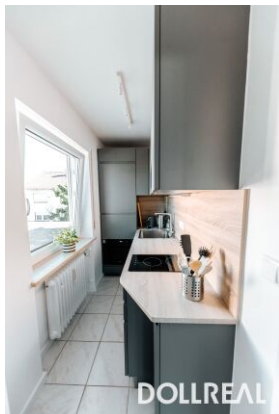
neue Küche mit Top-Ausstattung