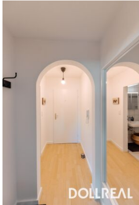
Garderoben- / Eingangsbereich