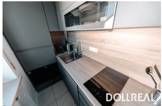
neue Küche mit Top-Ausstattung

KAUFEN & VERKAUFEN | BAUEN | FINANZIEREN | 50+